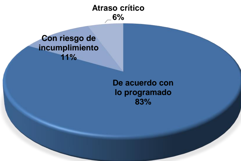
Gráfico 3 Ministerio de Vivienda y Asentamientos Humanos Seguimiento Cumplimiento de Metas Plan Estrategico Institucional 2019-2023 En Valores Relativos 30 de Junio de 2021

Fuente: Unidad de Planificación Institucional, con información de las Direcciones MIVAH