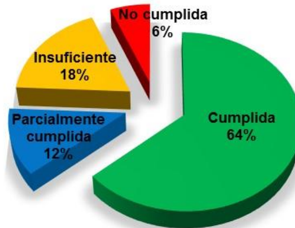
Gráfico N°5 Dirección de Gestión Integrada del Territorio Evaluación Metas de Plan Anual Operativo Año 2016 Valores relativos