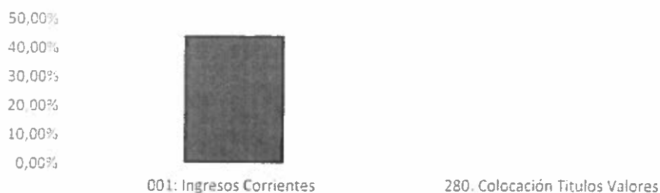
Gráfico N°2. Ministerio de Vivienda y Asentamientos Humanos Ejecución Presupuestaria según fuente de financiamiento Al 30 de junio del 2018