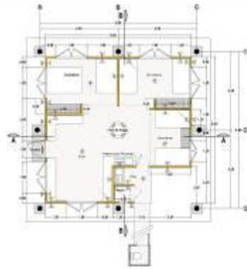
Planta de Distribución Arquitectónica Diseño: Ray Allan Jiménez Céspedes / arquitecto