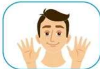
2 No se toque la cara si no se ha lavado las manos