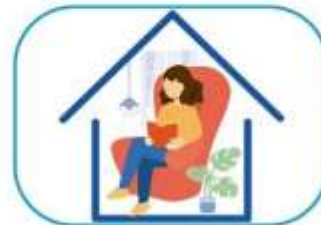
6 Quedate en casa