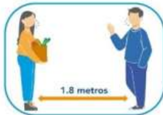
5 Distanciamiento social