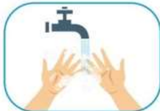
1 Lavado de manos