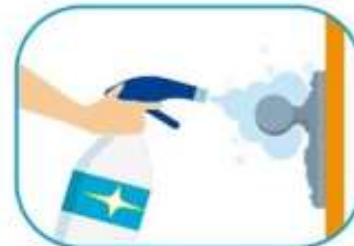
3 Limpiar las superficies de alto contacto