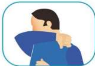
4 Protocolo de estornudo y tos